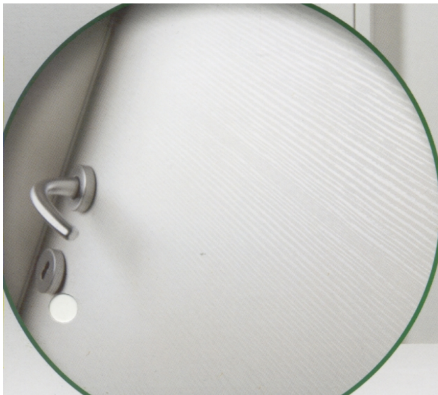
Bianco rigato in rilievo (poro aperto)